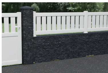
AJOURÉE HORIZONTALE OU VERTICALE