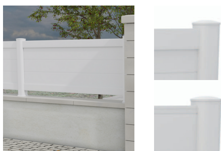
PLEINES AVEC OU SANS TRAVERSES